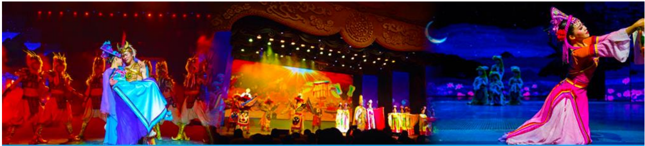
Romantic Show of Jiuzhai

หมายเหตุ : การท่องเที่ยวภายในอุทยานนั้นไกด์และหัวหน้าทัวร์ จะใช้วิจารณญาณในการนำท่านเดินทางท่องเที่ยวตามจุดชมวิวดังกล่าว ภายในอุทยาน ซึ่งจะพยายามไปเที่ยวให้ได้มากที่สุด เท่าที่สามารถทำได้ ทั้งนี้ขึ้นอยู่กับการใช้เวลาในแต่ละสถานที่ และความร่วมมือในการรักษาเวลาของคณะทัวร์ และสภาพอากาศในวันนั้นๆ ณ วันเดินทาง หากคณะไม่สามารถเดินทางไปชมอุทยานจิวจ้ายโกวได้ ไม่ว่าเนื่องจากสภาพอากาศ หรือเหตุผลใดๆ ทางบริษัทฯ ขอสงวนสิทธิ์ในการเปลี่ยนสถานที่ท่องเที่ยวเป็น “อุทยานแห่งชาติขงผิงโกว” และ/หรือสถานที่ที่เกี่ยวเนื่องแทน