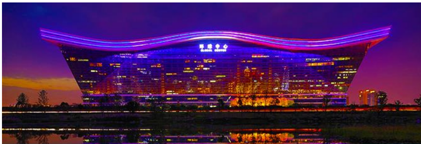
Chengdu new century global center