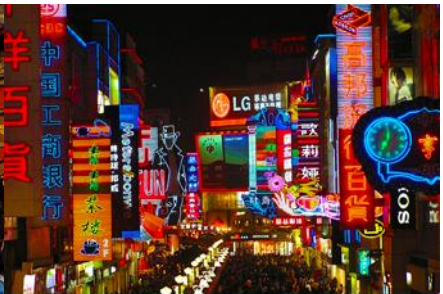
ถนนคนเดินชุนชู่