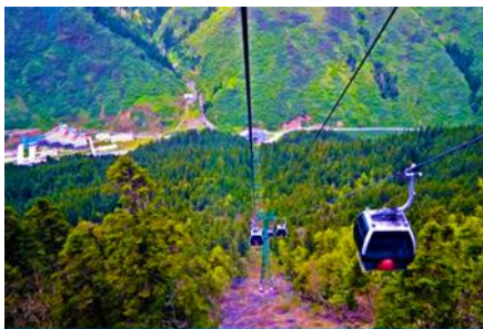
นั่งกระเช้าขึ้นสู่อุทยานหวงหลง

พักที่ JIUYUAN HOTEL ระดับ 4 ดาวท้องถิ่นหรือเทียบเท่าในอุทยานจิวจ้ายโกว