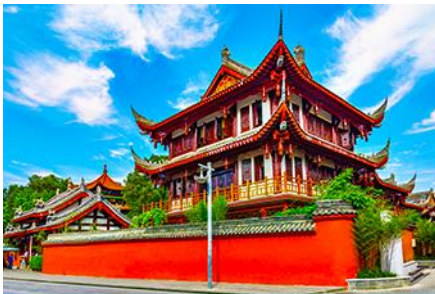
วัดเหวินชู่

พักที่ MAOXIAN INTER HOTEL โรงแรมระดับ 4 ดาวหรือเทียบเท่าในเมืองเม่าเซียน