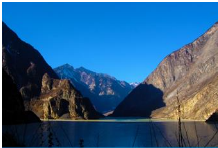
ทะเลสาบเต๋อซี