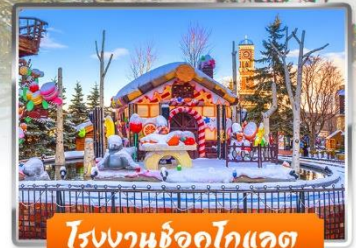
โรงงานช็อกโกแลต