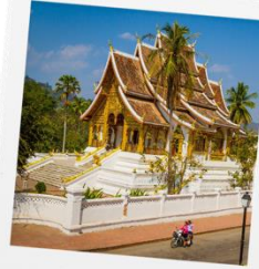
พิพิธภัณฑ์