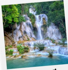
ตาดดวงสี