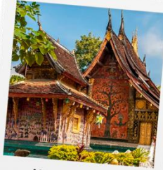
วัดเชิงทอง