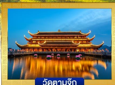
วัดตามจ๊ก