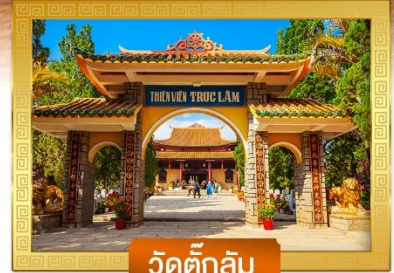
วัดตึกลิ้ม