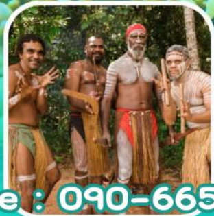
Rainforestation Aboriginal Show