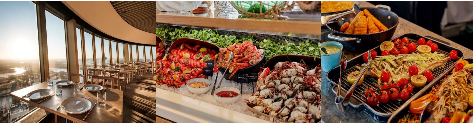
*เมนูมีการปรับเปลี่ยนตามฤดูกาล*

นำท่านเข้าสู่ที่พัก SYDNEY METRO MARLOW HOTEL / HOLIDAY INN POTTS POINT หรือเทียบเท่า (คืนที่5)