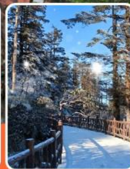
ภูเขาหว่าอูซาน