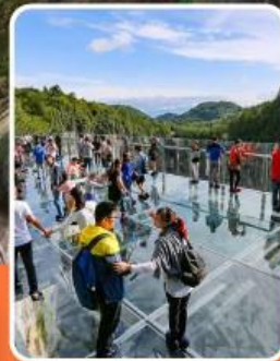
ระเบียงแก้วอู่หลง

ภูเขาหว่าอูซาน (รวมขึ้นกระเช้าไป-กลับ)- อุทยานเขานางฟ้า อุทยานหลุมฟ้าสะพานสวรรค์ - ระเบียงแก้วอู่หลง - รถไฟฟ้าทะเลตึก หงหยาดัง - วัดเป่ากิว - หลวงพ่อโตเลอซาน - วัดต้าฉือ หมี่แพนด้ายักษ์ ซ้อปิ้ง ถนนคนเดินซุนซีลู่ ไท่กู่หลี่