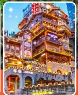
หงหยาดัง