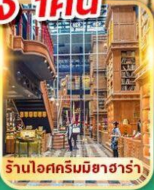
ร้านไอศกรีมมียาฮารา